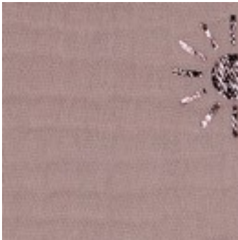
03642.015 SOFT ROSE