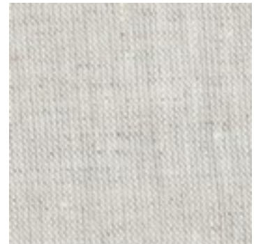
01031.006 OFF-WHITE / NATURAL