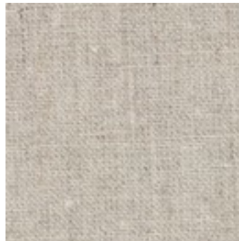
01031.005 NATURAL / NATURAL