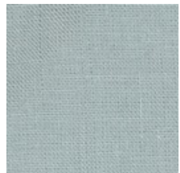
01031.009 MISTY BLUE