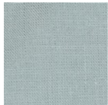
01031.009 MISTY BLUE