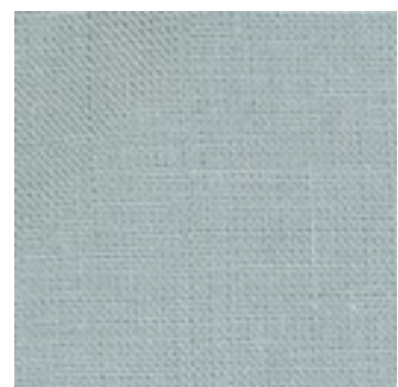
01031.009 MISTY BLUE