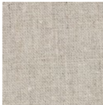
01031.005 NATURAL / NATURAL