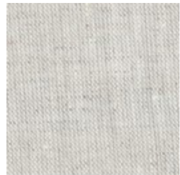
01031.006 OFF-WHITE / NATURAL