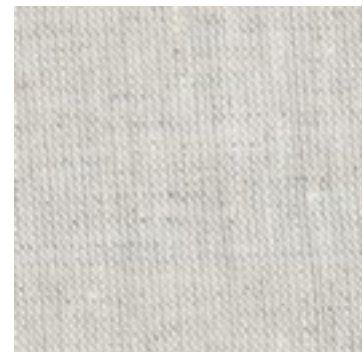
01031.006 OFF-WHITE / NATURAL