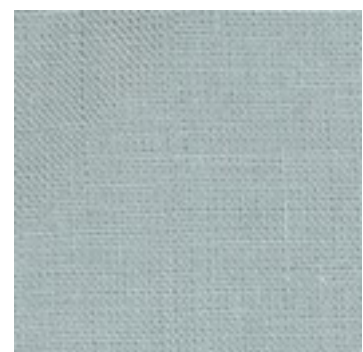
01031.009 MISTY BLUE