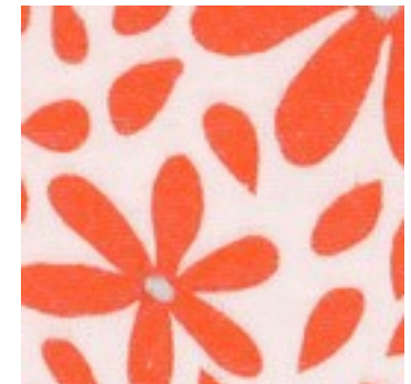
05529.010 LIGHT PINK