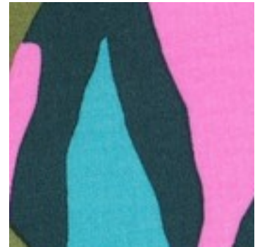
05373.004 DARK GREEN