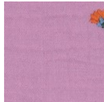
03650.065 LIGHT PINK