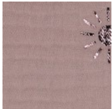
03642.015 SOFT ROSE