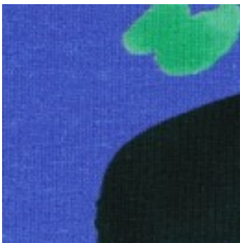
04047.013 LIGHT BLUE