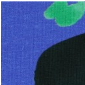
04047.013 LIGHT BLUE