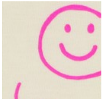
04117.001 OFF WHITE