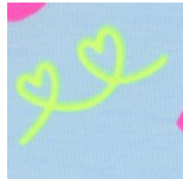
04117.002 LIGHT BLUE