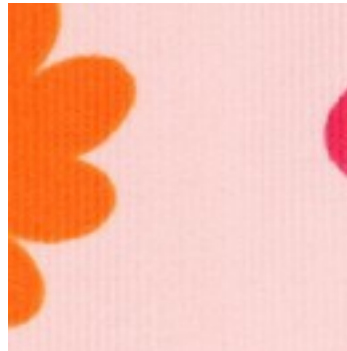
04073.004 LIGHT PINK