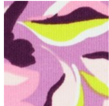
04135.005 PINK / LIME