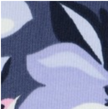
04135.003 BLUE / PINK