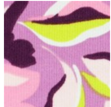
04135.005 PINK / LIME