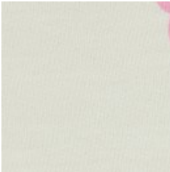
04136.002 OFF WHITE