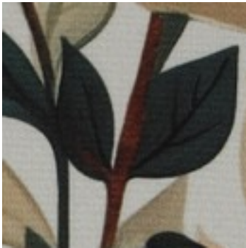
04178.001 OFF WHITE