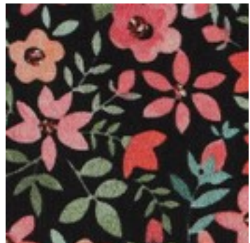
04080.002 BLACK / RED