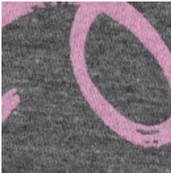
03113.055 GREY MELANGE