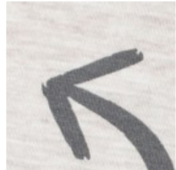
03113.076 BEIGE MELANGE