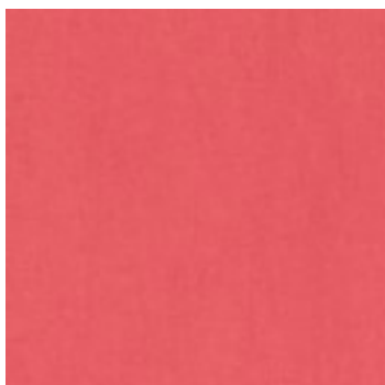
03497.007 BRIGHT CORAL