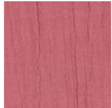
03496.006 DARK BLUSH