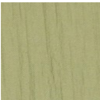
03496.007 OLD LIME