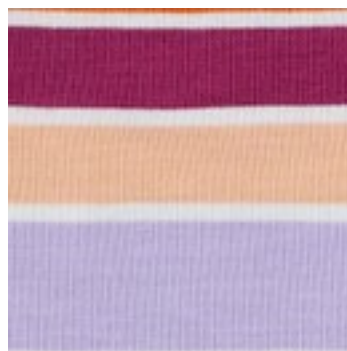
03101.015 MULTI COLOUR