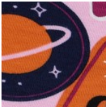
03101.004 LIGHT PINK