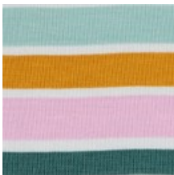
03101.013 MULTI COLOUR