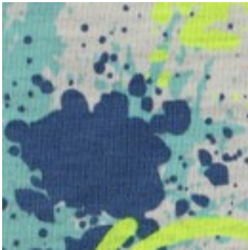
03077.002 ECRU MELANGE