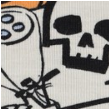
03102.001 LIGHT GREY