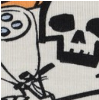
03102.001 LIGHT GREY