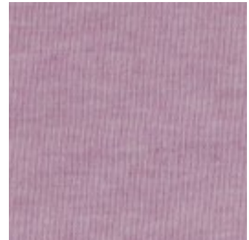
03144.019 LILAC MELANGE