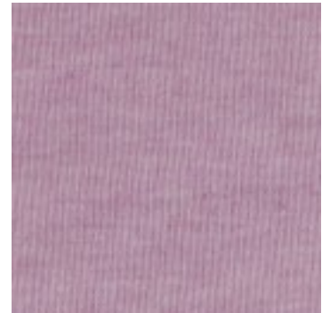
03144.019 LILAC MELANGE