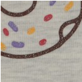
03144.001 ECRU MELANGE