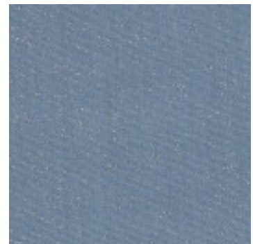
04226.049 LIGHT BLUE