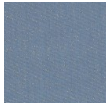
04226.049 LIGHT BLUE