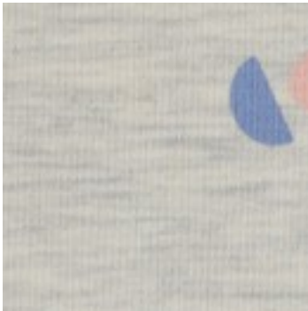
05332.001 ECRU MELANGE