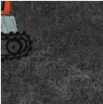
05416.001 DARK GREY