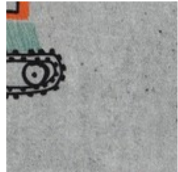
05416.003 LIGHT GREY