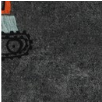
05416.001 DARK GREY