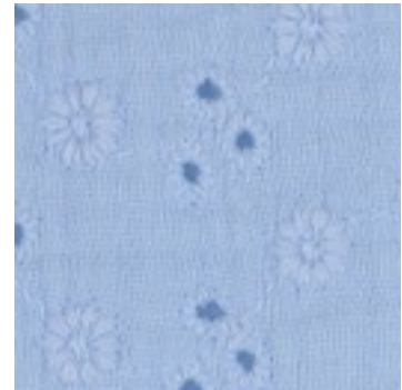
04922.004 LIGHT BLUE