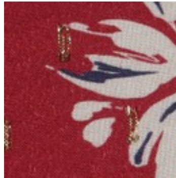
05802.007 ROSSO RED