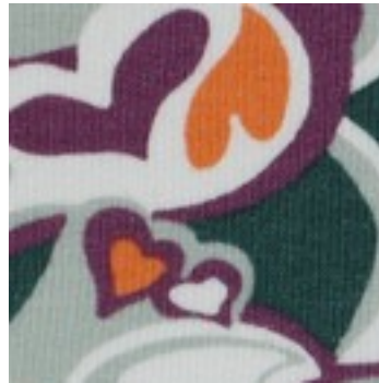
05439.005 DARK PETROL