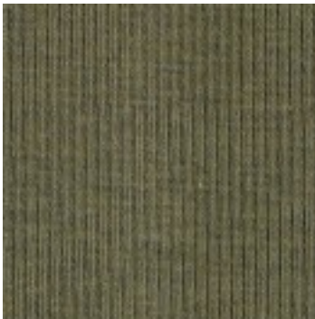
08492.034 ARMY GREEN