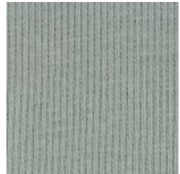
08492.036 OLD GREEN