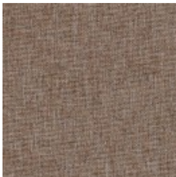
04589.004 LIGHT BROWN