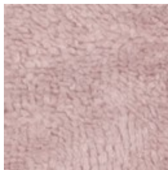
08850.011 OLD LILAC