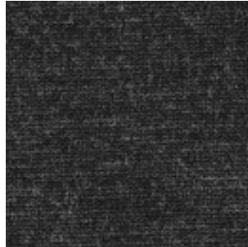
03800.014 DARK GREY MELANGE