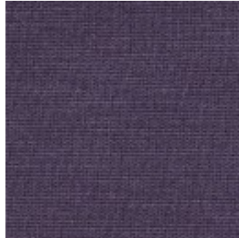
03800.030 DARK PURPLE