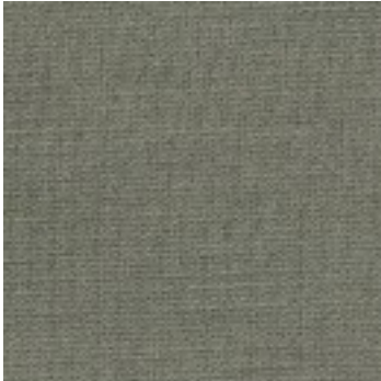
03800.029 ARMY GREEN