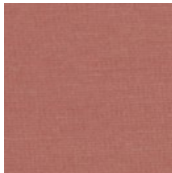
03800.024 OLD ROSE