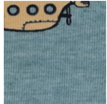
05823.032 SMOKE BLUE