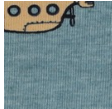
05823.032 SMOKE BLUE