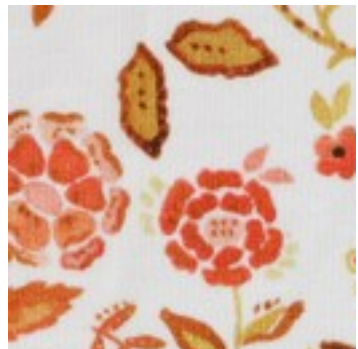
06064.001 WHITE PEACH