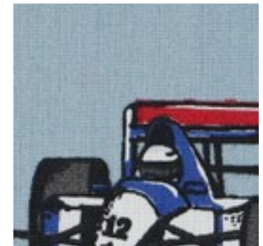
06041.007 LIGHT BLUE