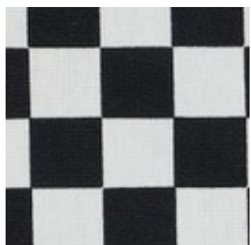
06041.011 FINISH FLAG BLACK WHITE