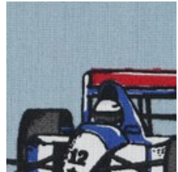
06041.007 LIGHT BLUE