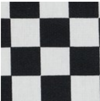
06041.011 FINISH FLAG BLACK WHITE