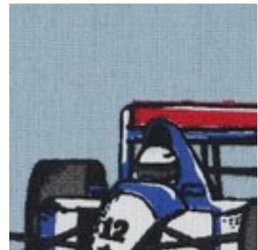
06041.007 LIGHT BLUE