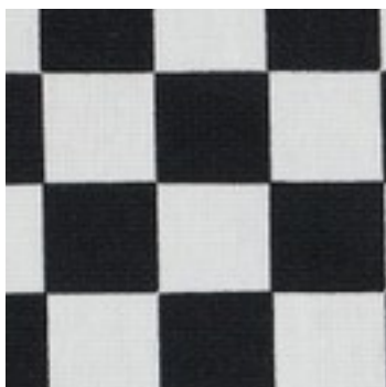
06041.011 FINISH FLAG BLACK WHITE