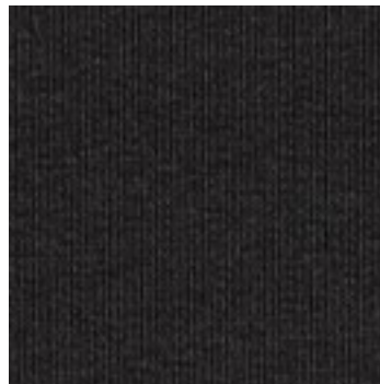
03064.003 DARK GREY