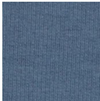
03064.006 BLUE SHADOW