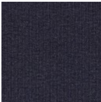
03064.005 DARK BLUE