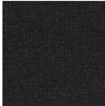
03064.003 DARK GREY