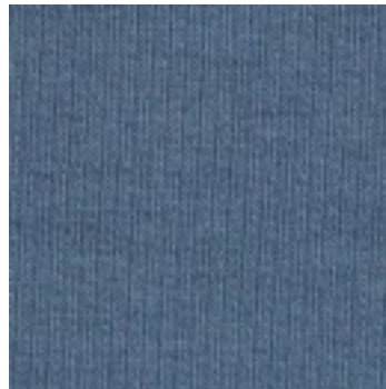
03064.006 BLUE SHADOW