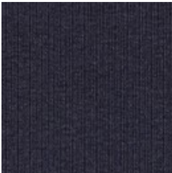
03064.005 DARK BLUE