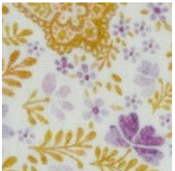
06870.013 WHITE/ LAVENDER