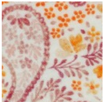
06870.012 WHITE/ OLD BLUSH