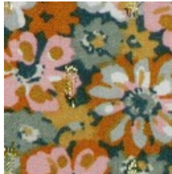
06677.005 DARK CYAN