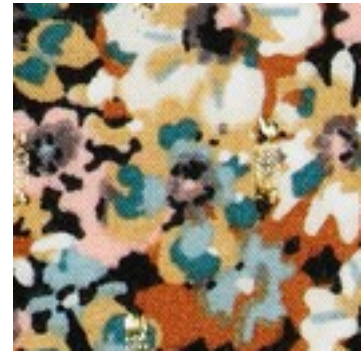
06677.007 BLACK/ HONEY